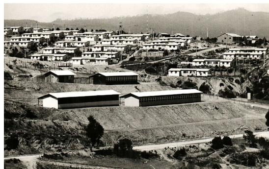
Figura 3. Vista general de Cooperativa Hamburgo (1960) y Escuela Básica (1967), 1968