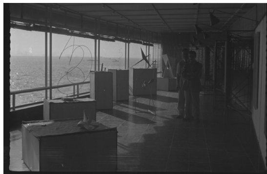
Figura 2. Exposición Pintores y Escultores Concretos Argentinos, Hotel Miramar, Viña del Mar, 1952