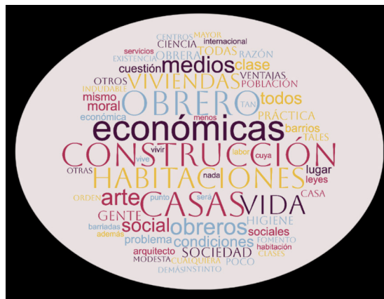
Lámina 1. Red Semántica artículo “Habitaciones económicas”, de Luis Cabello Lapiedra en El Arte y la Ciencia (1904)

En el discurso de Cabello Lapiedra destaca la percepción de la vivienda obrera como un instrumento para la regeneración social; la necesidad de distinguir el concepto de vivienda obrera en relación al de habitaciones económicas, percepción que permitiría la inclusión de otros trabajadores en los beneficios; la responsabilidad del arquitecto en el diseño y construcción de los barrios obreros; su oposición a la construcción de barrios “íntegramente obreros” en las zonas urbanas, procedimiento que desde su perspectiva terminaría por aislar a estos trabajadores. Además, Cabello Lapiedra consideró que el diseño de estas habitaciones económicas para la clase trabajadora debía contemplar condiciones de higiene, solidez, comodidad y servicios (Cabello, 1904). Este discurso denota una perspectiva higienista y modernizadora donde se colocaba el tema de la vivienda obrera en el núcleo de la discusión arquitectónica y no solo en el marco del debate sociopolítico. No debe perderse de vista que a Cabello Lapiedra se le consideró como un arquitecto de orientación ideológica conservadora, y que su enfoque corresponde a la realidad española, ya que este arquitecto no trabajó en México, sin embargo, cabe destacar que su artículo apareció en la revista de arquitectura más importante de la época en este país. A continuación, presentamos la red semántica que se formó a partir de realizar el análisis de contenido de dicha publicación.