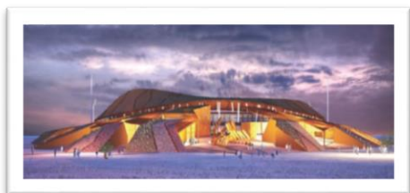
IMAGEN 2. PROYECCIONES DEL ESTADIO SONORA.